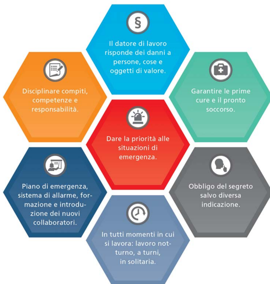
Figura 336-2: elementi costitutivi del piano d'emergenza

re conto del grado di istruzione, delle competenze tecniche e delle ulteriori capacità degli addetti al pronto soccorso (art. 321e CO).